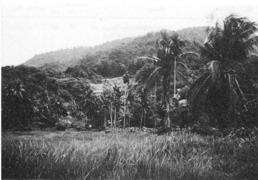
Abb. 3: Für beide Kampffische typische Lebensräume. In den warmen Stillwasser-Pfützen des Reisfeldes im Vordergrund leben Kleine Kampffische ( Betta imbellis ); dort, wo am Rand des Berglandes die Bäche der Ebene zufließen, lebt der Maulbrütende Kampffisch ( Betta pugnax ). Das Foto zeigt Fundort 6 in Abb. 1–2.

befindlichen Zinngrube gehört und hier Spülwasser eingeleitet wird. Doch zeigt dieses, welche extreme Anpassungsfähigkeit diese Tiere im Hinblick auf den Säurewert aufweisen. Im Hinblick auf die Wassertemperatur scheinen die Ansprüche deutlich enger zu sein. Ich habe sie nie in Wasser gefunden, das kühler als 28° C ist. Das erklärt ihre Vorliebe für offene, unbeschattete Flachwasserzonen. Im fließenden Wasser der Urwälder und Kautschukplantagen trifft man sie nur selten an, weil das Wasser hier normalerweise kühler als 28° C ist.