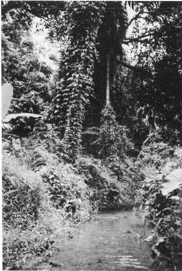
Abb. 4: Der Bach, in dem die Maulbrüter leben, aus der Nähe ( Betta pugnax ; Fundort 6).

Abweichend von den Angaben in Tabelle 1 fand ich im Subang Forest Reserve Betta pugnax auch in Wasser mit einer Temperatur von 27—28° C. Es war ein unbeschatteter Quellsumpf, aus dem ein ebenfalls mit Betta pugnax bevölkerter Bach entsprang. Der Bach hatte mittelstark strömendes Wasser und einen kiesig-sandigen Boden, enthielt nur sporadisch Pflanzen, aber viel abgestorbenes Laub von den Bäumen. Zwischen den Blättern hielten sich neben bunten Kaulquappen, vereinzelt Schlangenkopffischen ( Channa orientalis ), verschiedenen Barben- und Rasbora -Arten einige ausgewachsene, viel häufiger aber kleine, nur 0,5 bis 1 cm große Betta pugnax auf. Die Jungbettas fing ich ebenso häufig im Quellsumpf.