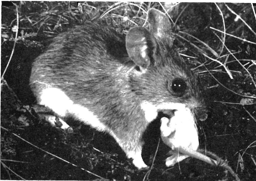
Abb. 5. Transport einer jungen Hausmaus (Albino)

Die das Bergungsverhalten auslösende Wirkung der Notrufe der Jungen zeigen weiterhin folgende Versuche: frisch getötete junge Gelbhalsmäuse werden vom Weibchen nur dann gefunden, wenn es z. B. bei der Futtersuche zufällig darüber hinwegläuft. Die toten Jungen werden in der Regel aber nicht eingetragen. Läßt man im Versuch dicht über einer jungen toten Gelbhalsmaus eine — für das Weibchen aber nicht erreichbare — junge Feldmaus ihre Notrufe aussenden, so lokalisiert das Weibchen die Stelle der Rufe, stößt dabei als erstes auf die tote Gelbhalsmaus und trägt sie ein. Diese Versuche gelingen regelmäßig auch mit jungen rufenden Rötel- und Hausmäusen. Bedingung ist nur: erstens, daß die artfremden Jungen rufen, um das Bergungsverhalten des Weibchens in Gang zu setzen und zweitens, daß sie in der Nähe der Attrappe rufen, um dem suchenden Weibchen das Auffinden der Attrappe zu ermöglichen. Nach Auslösung