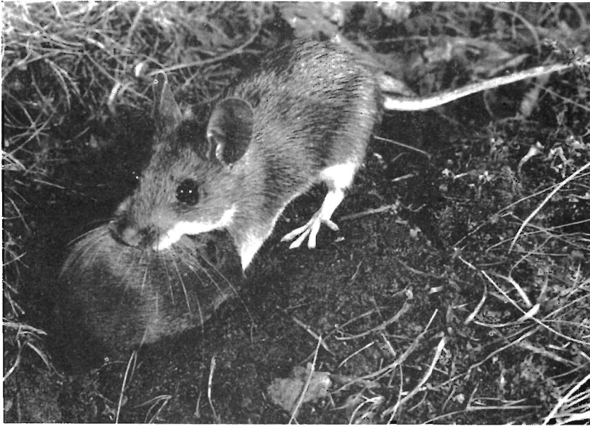
Abb. 3. Weibchen beim Jungentransport; das Junge in Tragstarre