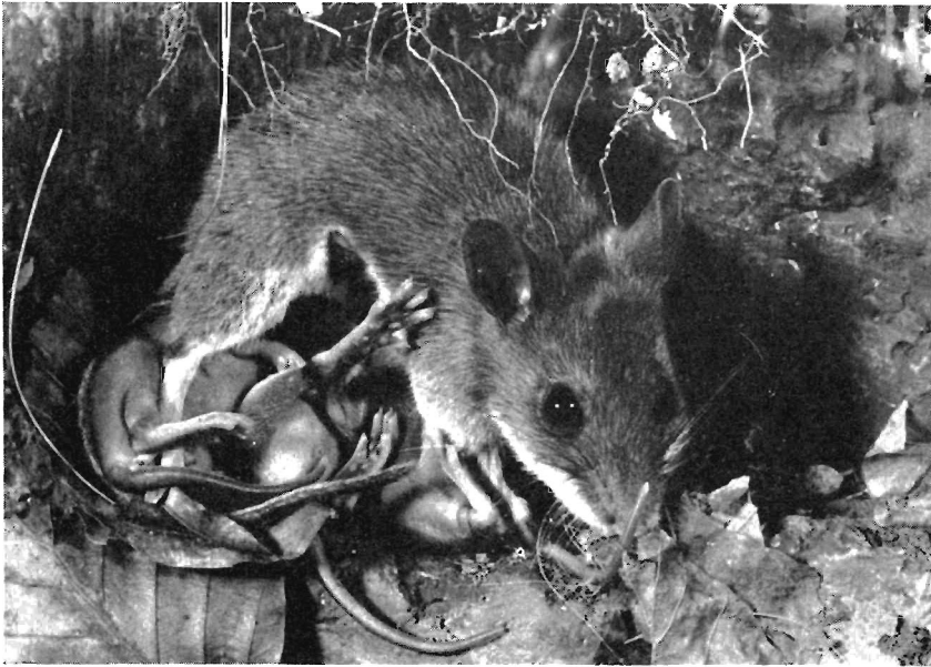
Abb. 2. Gelbhalsmausweibchen in typischer Säugstellung über den Jungen

für den Transport noch einmal recht „handlich“ zurecht drücken. Das Junge reagiert auf das Zufassen und das Bündeln durch das Weibchen mit dem Einnehmen einer Tragstarre, bei der der Körper eingerollt ist, und die Vorder- und Hinterpfoten, wie auch der Schwanz eng an den Körper angezogen sind. Die Augen sind im Zustand dieser Tragstarre 1) auch bei größeren Tieren geschlossen und die Ohren angelegt (Abb. 3). Bei der jungen Maus können jetzt beim Transport durch dichten Bewuchs oder enge Gänge keine abstehenden Körperteile mehr störend wirken. Ist ein Hindernis zu überwinden, so faßt das Weibchen mit den Vorderpfoten unterstützend unter das Junge, um erst dann wegzuspringen. Oft wird ein Junges vor dem Eingangslöcher zum unterirdischen Gangsystem abgelegt, das Weibchen schlüpft hinein und zieht es von innen durch den Gang zum Nest, ein Verhalten, das es auch beim Transport von Nistmaterial zeigt. Das Junge behält auch hierbei die Tragstarre bei. Nachdem es im Nest abgelegt wurde, verharrt es noch 6—7 Sekunden in völliger Starre.