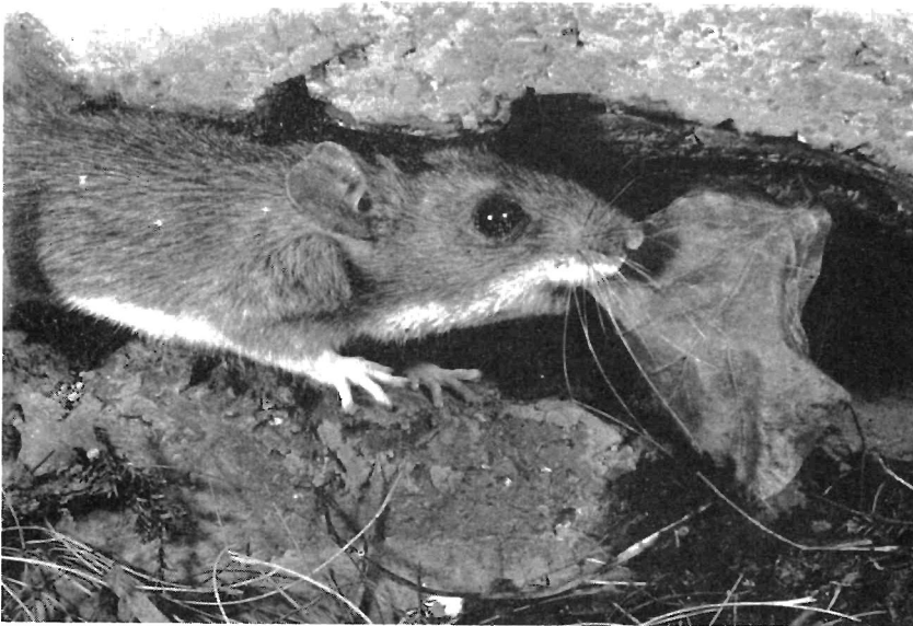
Abb. 1. Gelbhalsmausweibchen beim Eintragen von Nistmaterial

Von Brutpflege sprechen wir immer dann, wenn besondere elterliche Verhaltensweisen zum Schutze und zur Pflege der Jungen ausgebildet wurden, die ein möglichst ungestörtes Heranwachsen der Jungen gewährleisten sollen. Hierher gehören bei Mäusen — neben Ernährung und Sauberhaltung der Jungen — die Anlage eines Nestes, die Verteidigung des Nestes, wenn notwendig der Transport der Jungen in einen neuen Schlupfwinkel und die Bergung aus dem Nest geratener Jungtiere. Bisher liegen speziell für die Gelbhalsmaus außer einer Freilandbeobachtung von Curio (1955) über den Jungentransport und einer Arbeit von Zimmermann (1955) über „Gattungstypische Verhaltensformen von Gelbhals-, Wald- und Brandmaus“ keine eingehenden Untersuchungen zum Brutpflegeverhalten vor.