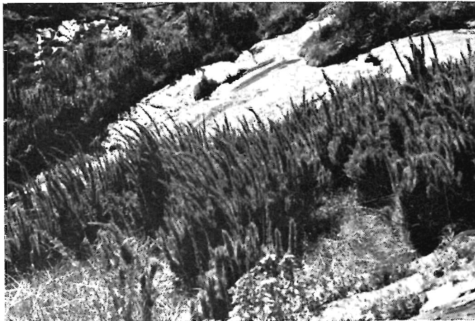
Abb. 4. Bezeichnender Biotop von Oreophylax auf der Serra do Caparaó, Minas Gerais; Bestand von Chusquea pinitolia .

Die mittlere Jahrestemperatur auf dem Itatiaia in 2200 m ist 13,3^{\circ} (entgegen 18,4^{\circ} in der Waldzone in 816 m Höhe). Die niedrigsten Temperaturen (selten unter -3^{\circ} C; selbst Charakterpflanzen wie Cortaderia sind frostempfindlich; Dusén 1955) führen besonders im Juni/Juli zu Reif und etwas Eisbildung. Die Höchsttemperatur geht im September und Oktober bis auf 23^{\circ} C (entgegen 35,3^{\circ} im Tal). Das ganze Jahr über sind starke Tageschwankungen bezeichnend (Tageszeiten-Klima). Die Zahl der Regentage ist auf den „campos“ viel höher als im Tal, nämlich 195 gegenüber 116 Tagen. Die Niederschläge konzentrieren sich im hiesigen Sommer (Oktober bis März; 306—404 mm Monatsmittel). Im Winter fällt oft wochenlang kein