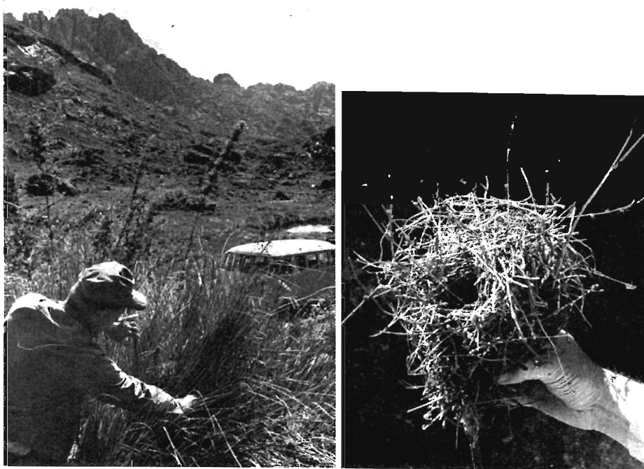
Abb. 2. Nest von Oreophylax moreirae in seiner natürlichen Umgebung. Im Vordergrund das Gras Cortaderia modesta und einige Wedel des Bambus Chusquea piniolia . Im Hintergrund der Gipfel der Agulhas Negras, 2787 m, höchster Berg des Itatiaia, Rio de Janeiro.

Das Nest schien lose in einem Grasbusch zu liegen, 80 cm über dem Boden (Abb. 2). Das Gras, Cortaderia modesta , ragte mit seinem scharfkantigen Schopf, der einem stammartigen Wurzelpolster entspringt, ringsum hoch auf und verbarg das Nest. Erst bei seinem Ergreifen bemerkte ich, daß die Vögel den Bau in einen kandelaberförmig verzweigten abgestorbenen Baccharis -Busch hineingestellt hatten, der in dem Gras aufgewachsen war. Auf diese Weise konnte man das äußerlich so lose Nestbündel unversehrt herausheben (Abb. 3). Nur einer der starken Grashalme war in das Nest eingefügt; möglicherweise wuchs das Gras noch, als die Vögel an ihrem Nest arbeiteten. Grüne Baccharis -Büsche, höhere Bambusdickichte und große Felsbrocken umgaben den Ort.