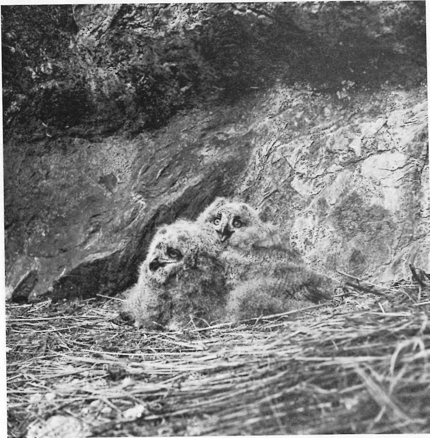
Abb. 2. Die Jungen Uhus von Brutplatz II.

Brutplatz I mit rund 400 Beutetieren liegt 460—470 m hoch am südlichen Steilufer des Abflusses aus dem Yraf (= See), gegenüber der Siedlung Adolfström. Brutplatz II in der Luftlinie 12 km flußabwärts in der Klamm des Merkfors (fors = Wasserfall) zwischen Gautojaure und Stor Laisann in 440—450 m Höhe. Vorherrschend im Laisdal ist der Kiefernwald, mit Birken gemischt. In spärlichen Beständen trifft man auch noch die Fichte (bis 500 m). Darüber zieht sich in Höhen von 600—700 m der Birkengürtel hin, der meist noch durch eine Strauchweiden-Zone von der eigentlichen Fjäll-Landschaft — jener Mittelstellung zwischen Alm und Tundra — getrennt ist. Die das Tal einrahmenden Gebirgsrücken bleiben im wesentlichen unter 1000 m. 20 km östlich von Brutplatz I liegen der Gipfel des Svaipa (1426 m) und das seenreiche Vogelschutzgebiet Svaipavalle, von dem Per Olof Swanbergs Buch „Fjällfåglares Paradis“ handelt. 10 km nördlich beider Brutplätze beginnt der Nationalpark Peljekaise. So besitzt das Laisdal, das hoffentlich bald in einen vergrößerten Nationalpark einbezogen wird, eine relativ ursprüngliche