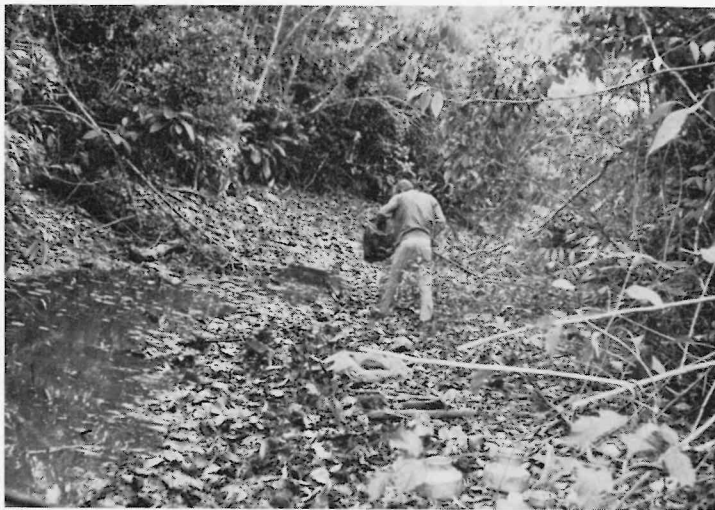
Abb. 2. (Biotop(-Ausschnitt) von Rivulichthys luelingi : flache, gesträuchumstandene Urwaldsenke mit klarem bis leicht trübem Flachwasser. Zur Niedrigwasserzeit sehr flach, meist unter einem halben Meter, mit reicher organischer Belastung (viele Äste und Baumstämme im Wasser, mäßig starker Laubfall — allochthone Substanzen); auf der Wasseroberfläche Pistia s p e c. und Wasserrosenblätter.