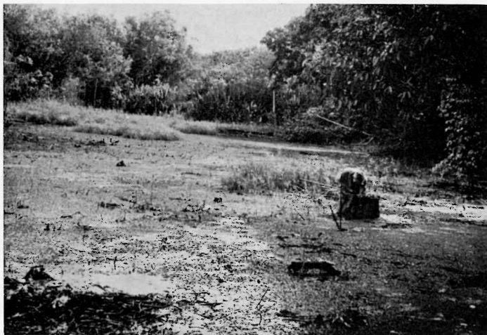
Abb. 3. Ein weiterer Biotop von Revulichthys luelingi : Stark verlandete Partie eines Altwasserarmes des Rio Chapare („Hoffmann Lagune“; Station „TS8“) bei Todos Santos, Ostbolivien, mit ganz flachem, nur wenige zentimetertiefem Wasser, das fast lückenlos mit Azolla filiculoides bedeckt ist.

Beschreibung: Körper gestreckt, vorne walzlich, etwa ebensobreit wie hoch, nach hinten zu seitlich etwas zusammengedrückt, die untere Schwanzstielkante aber nicht blattartig. Kopf etwas breiter als hoch, die Kopfhöhe 1,05—1,15mal in seiner Breite. Körperhöhe in der Gesamtlänge (inkl. Caudale) 5,7—5,85mal, in der Körperlänge 4,5—4,7mal enthalten; die Kopflänge in der Gesamtlänge etwa 3,9—4,3mal, in der Körperlänge 3,2—3,4mal. Auge groß, erreicht oben das Frontale, in der Kopflänge nur 2,6—2,7mal enthalten, in der Schnauzenlänge 0,5—0,6mal, in der Interorbitalbreite 1,15—1,25mal, Schwanzstiel kurz, seine Höhe 1,1mal in seiner Länge.