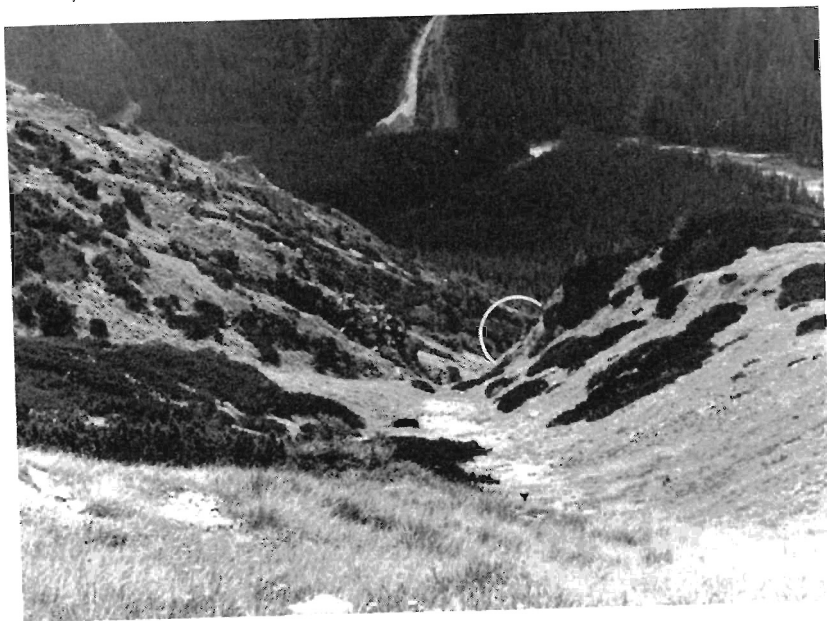
Abb. 5: Blick von oben auf die Lokalität nach Abb. 4. Im Vordergrund eine Murmeltierkolonie, im weißen Kreis hinter dem Felsriff dieselbe Hütte.

der Art Rhinolophus hipposideros aus Mähren folgende durchschnittliche Grenzwerte des Körpergewichts fest: erwachsene Männchen — Minimum 5,6 g im März, Maximum 8,7 g im November; erwachsene Weibchen — Minimum 6,3 g im März und April, Maximum 8,8 g im November. Zu ähnlichen Folgerungen gelangte auch Krzanowski (1961) für einige andere Arten.