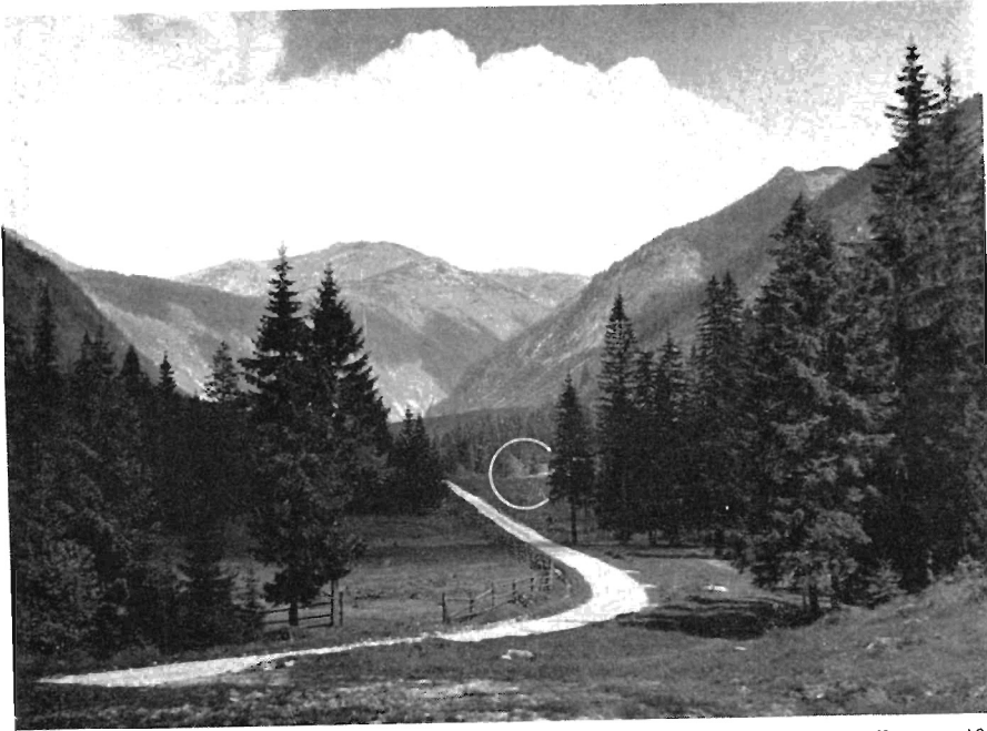
Abb. 3: Sommerstandort von Eptesicus nilssoni und Myotis mystacinus . Der weiße Kreis bezeichnet den Waldrand und die Wiese, wo die Nordischen Fledermäuse noch vor Einbruch der Dämmerung jagten.

in starkem Schneegestöber und war offenbar entkräftet, da diese Witterung bereits mehrere Tage dauerte.