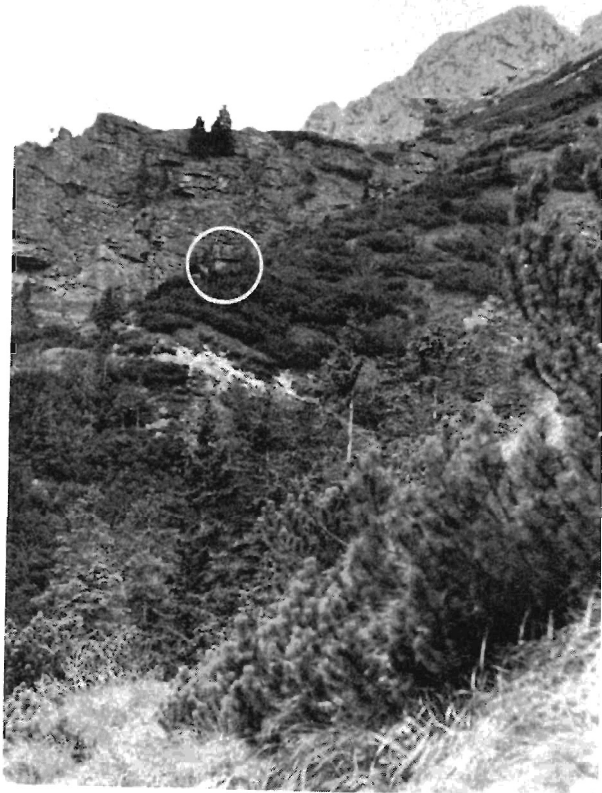
Abb. 4: Tagesversteck von Eptesicus nilssonii in der Knieholzzone, 1450 m ü. d. M. Im weißen Kreis die Hütte, wo das Exemplar Nr. 62 554 gefunden wurde.

Unser Material ist zwar nicht sehr reich, zeigt jedoch in groben Zügen ein Schwanken des Körpergewichts im Laufe des Jahres, das bei dieser Art nicht bekannt ist. Wie Tabelle 1 zeigt, ist der Unterschied zwischen dem Mindestgewicht im Februar von 6,5 g und dem Höchstgewicht im August von 17,5 g außerordentlich groß (beide Werte betreffen erwachsene Weibchen). Dabei halten unsere Beobachtungen nicht einmal extrem ungünstige Perioden fest, wie sie für die Tatrpopulation der Nordischen Fledermaus wahrscheinlich im April und Anfang Mai gegeben sind. Man kann daher annehmen, daß das Körpergewicht einzelner Exemplare innerhalb noch größeren Grenzen schwankt und sich vom Frühjahr bis zum Herbst fast verdreifacht, um dann im Laufe des Winters wieder zu sinken. So bedeutende Schwankungen des Körpergewichts sind bei keiner der anderen europäischen Fledermausarten bekannt, bei denen es während der Sommerperiode maximal zu einer Verdoppelung des Körpergewichts kommt. So stellte Gaisler (nicht publiziert) bei einer großen Serie von 1816 Exemplaren