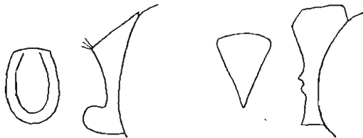
Abb. 6 Abb. 7 Abb. 8 Abb. 9

Das breite und kurze Pygidium ist fein chagriniert und undicht punktiert. Der Prosternalzapfen ist bei Ch. felschei Heller hinten abgerundet, an der Spitze breit abgestutzt und tief ausgehöhlt (Abb. 6, 7), bei Ch. borchmanni n. sp. ist er hinten scharf gekielt, an der Spitze flach gewölbt (Abb. 8, 9). Die Unterseite sowie die Beine und Fühler sind sonst ähnlich wie bei Ch. felschei Heller gebaut.